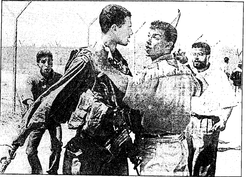
شباب فلسطين يتصدون للشيطان الإسرائيلي